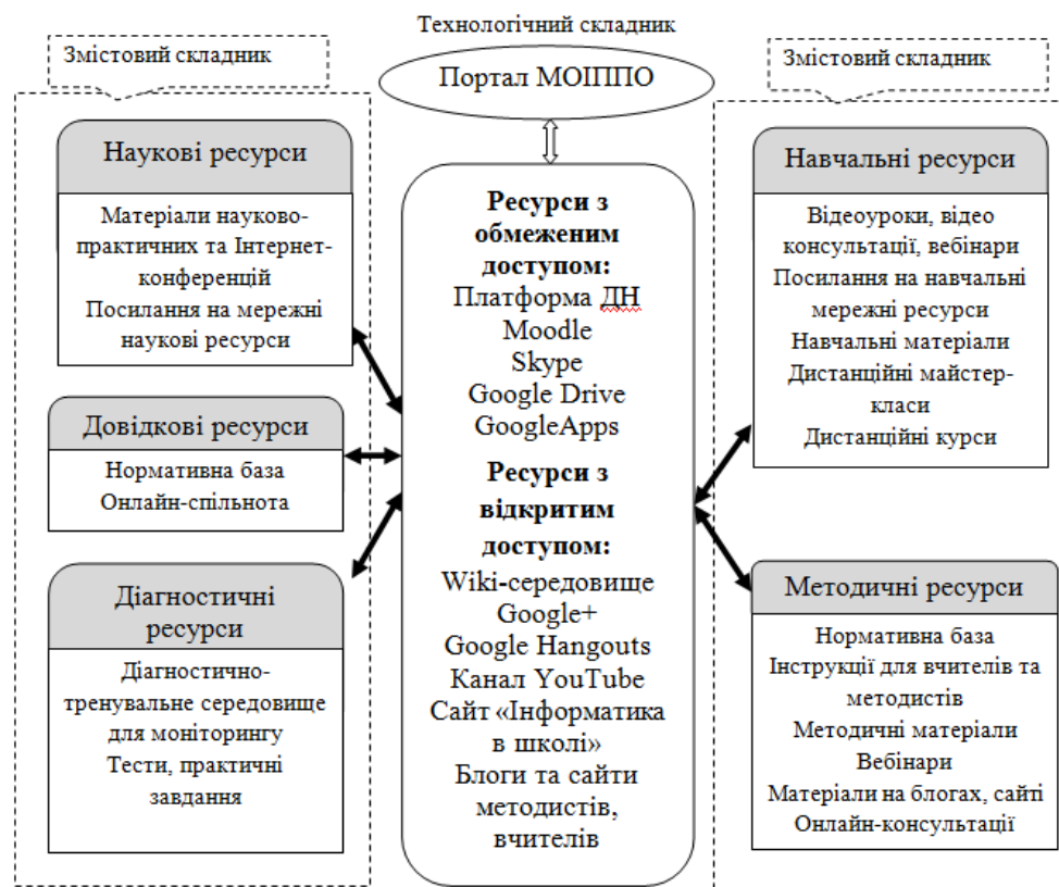
Рис. 2. Зв'язок змістового та технологічного складників інформаційно-освітнього середовища підвищення кваліфікації

Розглянемо зв'язок ресурсів змістового та технологічного складника інформаційно-освітнього середовища в процесі підвищення кваліфікації вчителів інформатики, що реалізований в Миколаївському обласному інституті післядипломної педагогічної освіти (Рис. 2).