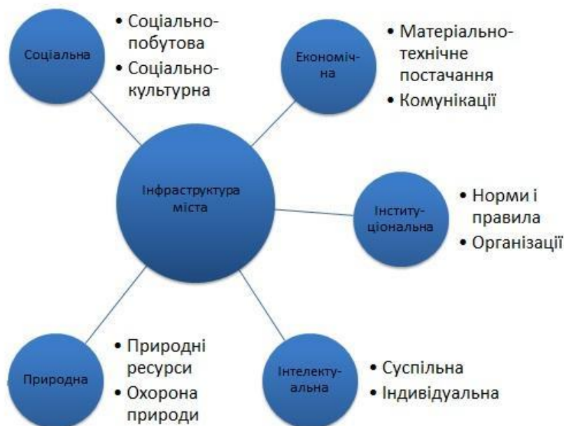
Рис.2. Інфраструктура міста

Загалом, інфраструктуру міста трактують як сукупність елементів, які можна згрупувати в п'ять основних блоків: соціальна, економічна, інституційна, інтелектуальна і природна інфраструктура (рис. 2).