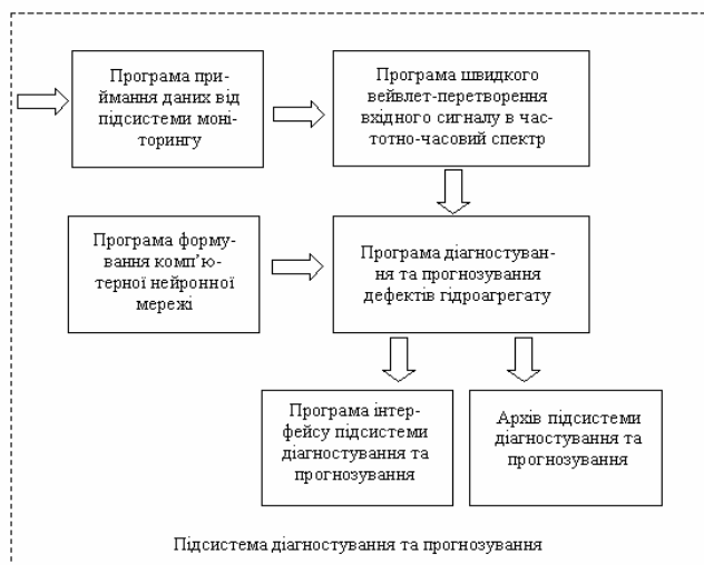
Рис.1. Підсистема діагностування і прогнозування дефектів гідроагрегату

Система автоматизованого діагностування і прогнозування розвитку дефектів гідроагрегату (САДП-РДГ) є апаратно-програмним комплексом [1], який складається з двох підсистем – підсистеми поточного моніторингу вібрацій та підсистеми діагностування та прогнозування, структурна схема якої зображена на рис.1.