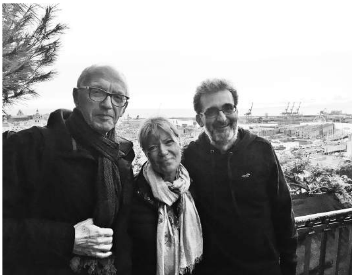
З Alain Bron та Augusto Azuara-Blanco

Окрім того, хочеться згадати про важливе зібрання офтальмологів у рамках конференції «Глаукома + 2019», яка, за коментарями учасників, пройшла успішно. Велике значення мали лекції членів НАН і НАМН України, академіка М. Веселовського та В. Цимбалюка, члена-кореспондента Б. Маньковського, світових лідерів з глаукоми проф. Н. Пфейффера (Німеччина), А. Хоммера (Австрія), А. Мокбеля (Єгипет), проф. У. Шпандау (Швеція) та провідних професорів з України при обговоренні важливих тем програми. Позитивну оцінку отримали й чисельні майстер-класи за сучасними технологіями діагностики та лікування в офтальмології.