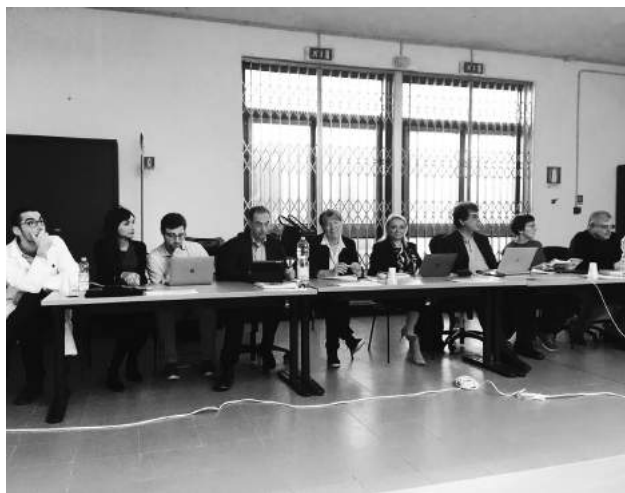
З членами президії EGS (розподіл на групи)