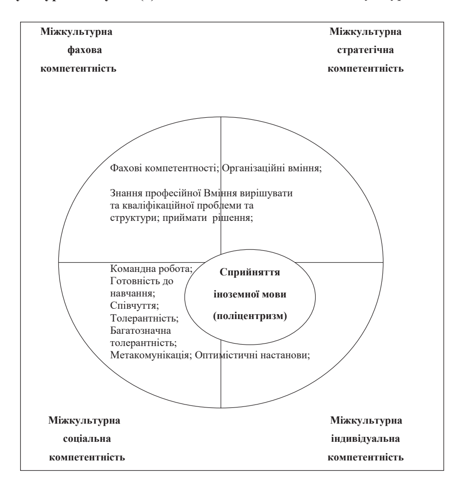
Рис. 2. Площина моделей міжкультурної компетентності (5)

Міжкультурні компетентності, наведені на рис. 2, необхідні для того, щоб вміти діяти чуйно, рефлексивно, адекватно та ефективно в ситуаціях міжкультурного перетину — у взаємодії з представниками інших культур.