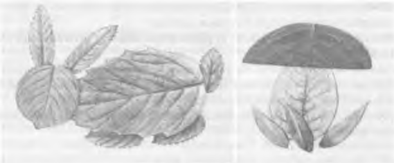
Мал. 2. Зразки виробів з природного матеріалу.

Так, наприклад, корекційно-розвивальні завдання з формування навичок ручної праці (Комплекс програмно-методичного забезпечення «Трудове виховання» для дошкільників з розумовою відсталістю) мають певну структуру: опис послідовності виконання завдання та інструкційну картку, цікаві віршички та загадки, підібрані до заданого об'єкту праці.