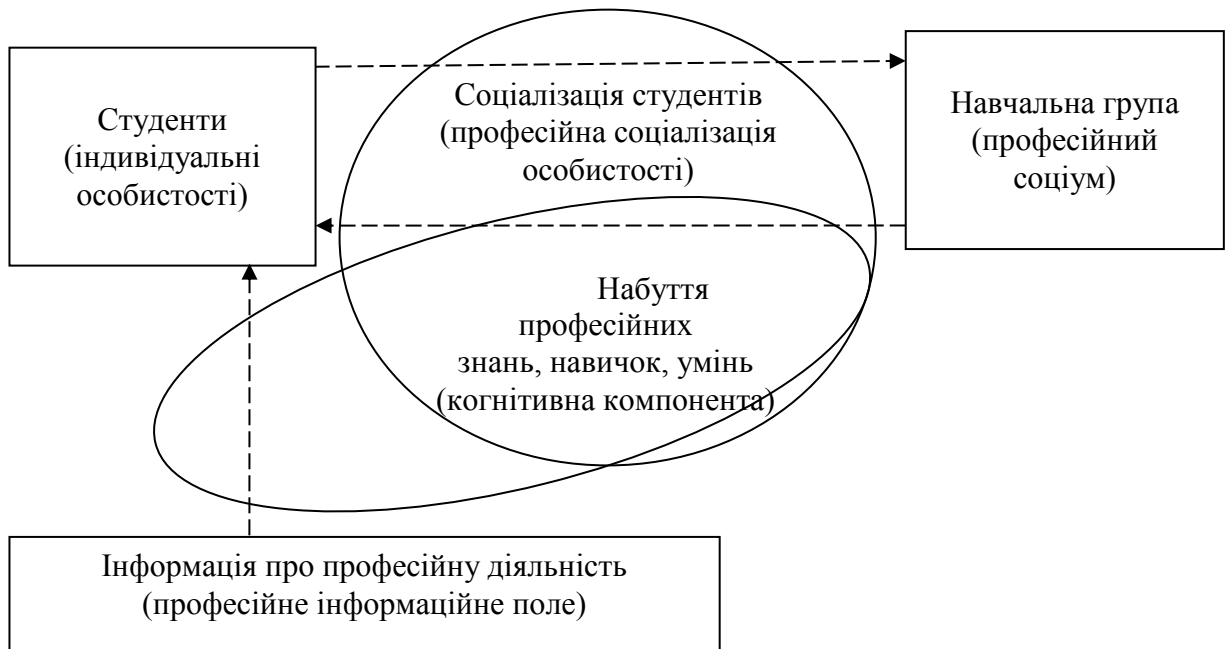
Рис. 2. Професійна соціалізація особистості студента в ході навчального процесу

Рис. 2 зображує процес подальшої професійної соціалізації особистості студентів в ході навчального процесу. З'являється і набуває визначального значення фактор пропонованої