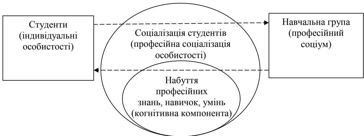
Рис. 1. Професійна соціалізація особистості студентів в процесі формування ними навчальної групи

даному контексті як професійний соціум. Виходячи з онтологічного принципу холізму, даний соціум не є простою сумою індивідів, що його складають, оскільки в процесі свого формування генерує додаткові, ексклюзивні характеристики, які переробляються, засвоюються за допомогою когнітивної компоненти особистості студентів в процесі їх адаптації до нових умов зовнішнього середовища. Тобто друга стадія визначається впливом сформованого професійного соціуму (навчальної групи) на індивідуальну особистість студента. Таким чином, перша стадія (1) розглядається як стадія соціалізації, друга (2) – власне професійної соціалізації. У процесі набуття професійних знань, навичок, умінь в даному випадку під «професійними» маються на увазі ті, що формують здатності до навчання. Специфіка описаного процесу полягає в тому, що індивідууми не тільки визначають себе в професійному соціумі, але і сам професійний соціум (у вигляді навчальної групи) визначається, формується ними.