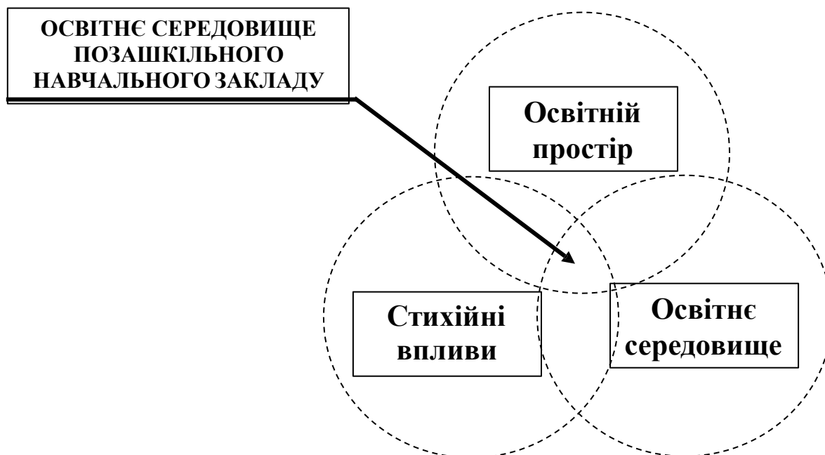
Рис. 1. Базова графічна інтерпретація моделі взаємодії основних компонентів освітнього середовища позашкільного навчального закладу

До основних змістових компонентів освітнього середовища позашкільного навчального закладу, на нашу думку, належать: креативний компонент, ігровий, розвивальний, афективно-емоційний (рис.2.). Звідси впливають основні функції освітнього середовища позашкільного навчального закладу: освітньо-пізнавальна, креативна, розвивально-ігрова, афективно-емоційна. Зазначені функції реалізуються через змістовне наповнення всієї діяльності позашкільного навчального закладу як освітньо-виховної системи.