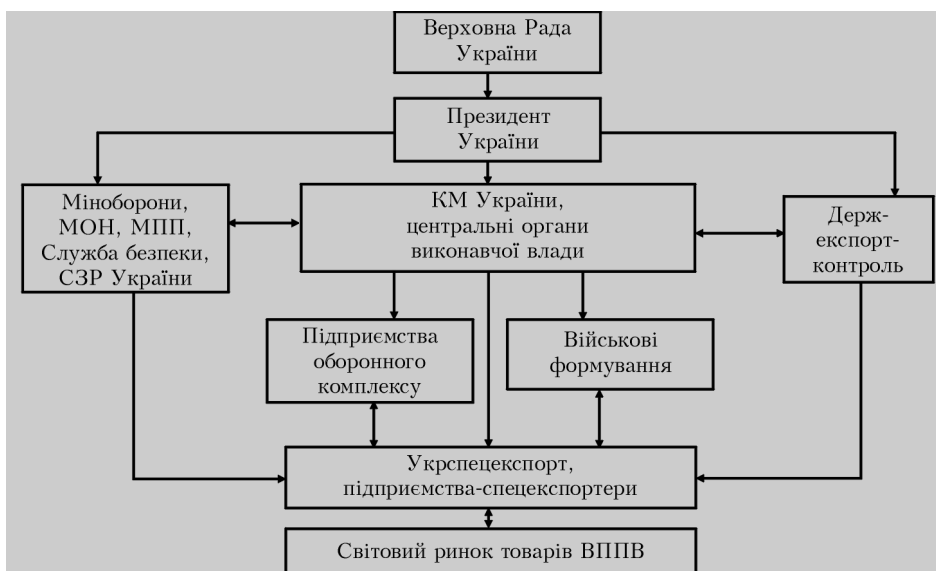
Рис. 1. Загальна структура національної системи ВТС України

лись в 55 млн доларів США, що практично дорівнювало половині суми контракту.