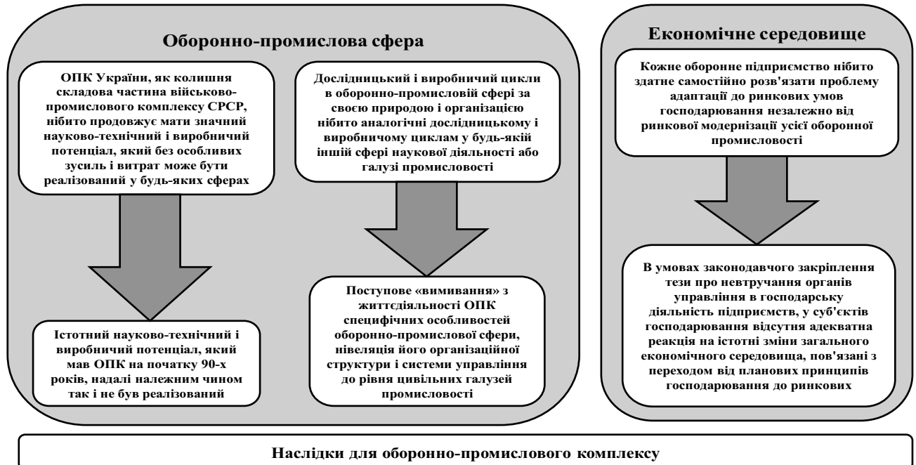
Рис. 1. Помилкові уявлення, що зумовили нинішній несприятливий стан оборонно-промислового комплексу України, та їх наслідки

принципів господарювання й переходом до ринкових відношень згідно робіт [1, 18].