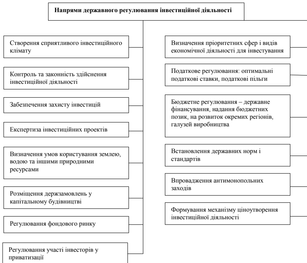
Рис. 4. Основні напрями державного регулювання інвестиційної діяльності [17; с. 10].

Для подальшого покращення інвестиційного клімату України актуальним на сьогодні є питання удосконалення напрямів державного регулювання інвестиційної діяльності, зокрема, правової та організаційної бази для підвищення дієздатності механізмів забезпечення сприятливого інвестиційного клімату й формування основи збереження та підвищення конкурентоспроможності вітчизняної економіки. Основні напрями державного регулювання інвестиційної діяльності наведені на рис. 4.