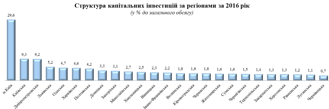
Рис.3. Структура капітальних інвестицій за регіонами за 2016 рік. [4].

інвестицій за регіонами наведена на рис. 3. Чернігівська область за даним показником знаходиться на 19 місці.