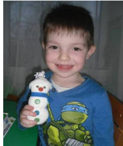
Сніговички зі шкарпеток

Найбільш яскравою формою вираження креативності є зображувальна діяльність та виготовлення доробок . Хотілося б приділити більше уваги виготовленню доробок, оскільки вони містять поліфункціональний характер. Процес їхнього виготовлення проходить переважно під час занять зі самостійної художньої діяльності та у вільний час продовж дня. Під час виготовлення кожної доробки додатково закріплюється тема тижня, часто діти сприймають цю інформацію на підсвідомому рівні. Про розвиток сенсорно-пізнавальної діяльності мова вже навіть і не йде. Будь-який кваліфікований вихователь підтвердить, що займатися творчістю необхідно мало не з маминого животика. Наприклад, готуючись до захисту українознавчого проекту, ми виготовили національні обереги. Працювали тривалий період часу, наполегливо й натхненно. Спільними зусиллями ми розмалювали дві великі писанки з пап'є-маше. Пап'є-маше виготовили самотужки, однак старшу групу плануємо зацікавити цією технікою під час виготовлення тарілочки з українським орнаментом. Наклеювання шматків паперу клейстером – цілком посильне та безпечне завдання для дітей старшого дошкільного віку. Візерунок обирали вихованці відповідно до вивченої напередодні народної символіки писанок. На одній з них зобразили волошку та мак, оскільки хлопчики й дівчатка хотіли розмежувати таким чином зони творчості. Їм було надано можливість втілити власне бачення писанки. Інша писанка вийшла у найкращих традиціях писанкарства. Тут і хвиляста лінія, як символ