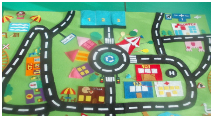
Килим «Дороги Ужгорода»

Творчо підходжу і до проведення святкових ранків. Обов'язково залучаю до них батьків. Наприклад, для конкурсу «Малятко» пошили спеціальну ширму з отворами для рук тата й мами, що стала основою проведення жартівливого дійства. Також тати дівчат затанцювали з ними зворушливий танець для мам. Ці ідеї запозичила з каналу YouTube, творчо переосмисливши та доповнивши їх.