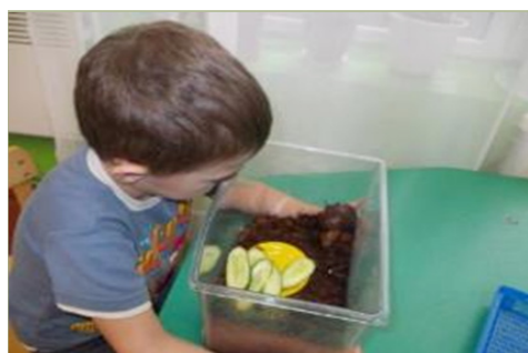
Догляд за равликами

Дітки, де живуть равлики? (У травичці). Показую, що бувають равлики різні (звичайний, акваріумний та африканська ахатіна). Як бачимо, у природі багато несподіванок. Равлики бувають різними і кожен з них цікавий по-своєму. Бувають равлики без хатинки, вони називаються слизнями. Наш равлик ахатіна приповз із далекої Африки. Він – маленький мандрівник. Уявіть, яку відстань довелося йому подолати, щоб подружитися з нами. Він – сміливий та наполегливий. Пропоную дітям намалювати хатинку равлика: з димарем, дахом, вікнами, шторками на вікнах. Можливо, через віконечко буде видно піаніно. Далі можуть пропонуватися інші варіанти: