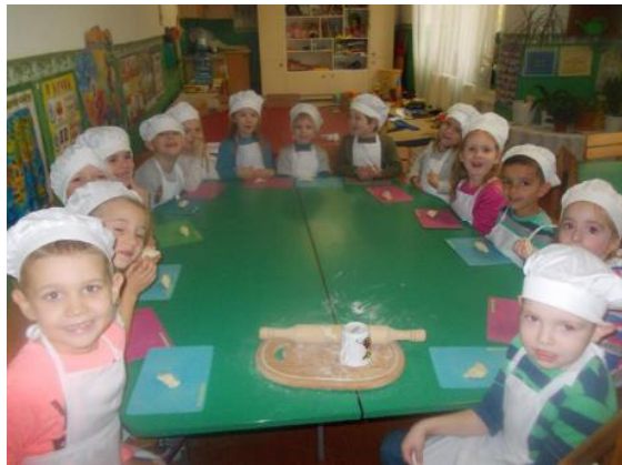
Вареники до свята

Пишаюся тим, що дітки, мої маленькі веселі чомусики, приготували у стінах групи перші вареники, імбирне печиво, перший хліб.