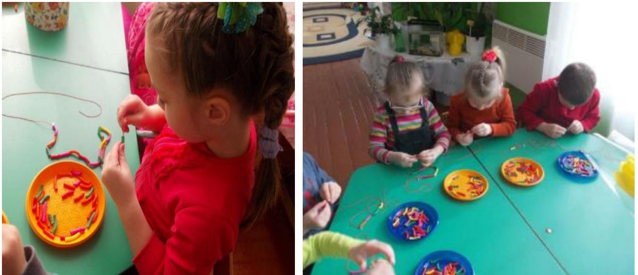
Намисто з макаронів

Фарбуванням макаронів краще зайнятися вихователю, і робити це акриловими фарбами. Така фарба не потребує додаткової обробки і не залишає слідів на одязі після висихання. Проте, за бажання можна доручити це вихованцям, засипавши у пакет сухий барвник і попросивши «масажувати макарони» у зав'язаному пакеті. Отже вам знову сенсорна вправа! До слова, у молодшій групі ми вирізали формами з тіста печиво для мамі і прикрашали його кольоровим рисом . Так-от, рис для доробки фарбували саме в такий спосіб. Раджу насипати рис одразу у подвійний пакет, щоб уникнути розсипання. Така собі рисотерапія, а для манкографії та манкотерапії згодиться піднос з манною крупою. Готові макарони нанизуюмо на нитку. Починаючи з середньої групи рекомендовано практикувати багатошаровість намиста. Ми нанизали подвійне. Якщо ідея сподобалася вам та вихованцям – не бійтеся повторити її, ускладнивши наступного року. Плануємо у старшій групі створити браслети з дрібних макаронів. Використаємо їх в якості бісеру для створення геометричного візерунка. Якщо плетіння з бісеру – складне заняття для дитини дошкільного віку, то розмір макаронів і розвинена моторика рук 6-річної дитини цілком сприяє виготовленню візерунчастого браслетка. А, якщо використати жовту й блакитну фарби, краса буде ще й патріотичного забарвлення.