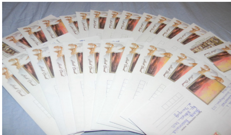
Листи від Пана Добрика