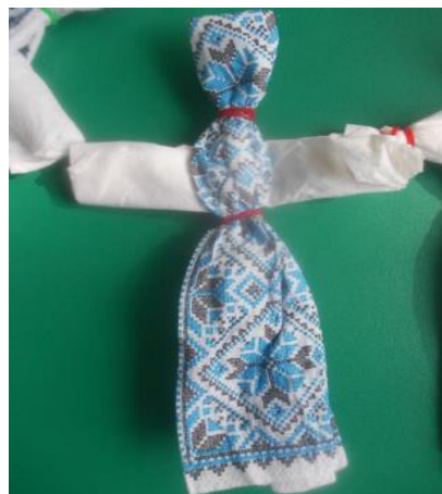
Перші у житті виготовленні власноруч ляльки-мотанки

Весна – пора, коли всім нам доводиться креативити. Тут Міжнародний жіночий день та День матері, а для мами хочеться підготувати найкращі подарунки. Минулого року ми підійшли творчо до виготовлення святкового сюрпризу: зробили чудові намиста з кольорових макаронів . Для його створення спочатку необхідно обрати макарони. За формою їх є неймовірна кількість. Не дарма ми почали збирати колекцію. Ми з дітками використали звичайні «пера».