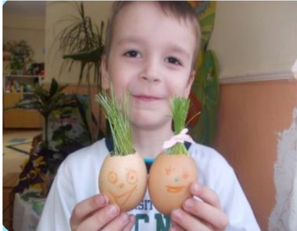
Травичка у шкаралупі

темами та барвниками. Ми розділили суцвіття хризантеми на кілька частин і помістили кожну з них у стаканчик з розведеним барвником. На наступний день квітка, що стояла у жовтому барвнику, стала жовтою, у червоному – червоною, у блакитному – блакитною. Отже, водичка піднімається по стовбуру до листячка і пелюсточок, а не залишається в корінцях. Перебуваючи у середній групі ми стали садівниками. Посадили квіти на клумбі, кущ калини, виростили з каштана дерево. Не забули і про традиційний міні-город на підвіконні. Тільки цього разу ми створили плантацію мандаринів. Проростили з мандаринового насіння рослини.