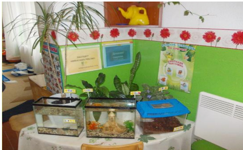
Наш живий куточок

Якщо листочок чи каштанчик ще можна принести до приміщення групи для замальовування, то їжачка чи черв'ячка – ні. Проте, завжди є вихід. Організувавши незвичайний живий куточок у групі, ви зможете спостерігати, досліджувати, доглядати, перемальовувати, вигадувати [10].