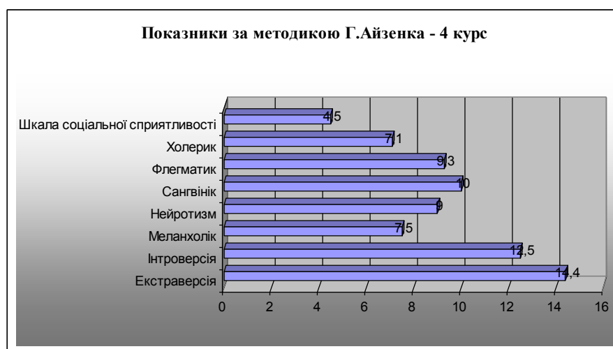
Рис. 2. Показники за методикою Г. Айзенка після проведення формувального експерименту

За норми шкали соціальної сприйнятливості в 4 бали в нашому дослідженні показники перебувають у межах норми – 4,5 бали. Графічно ці результати наведено на рис. 2.