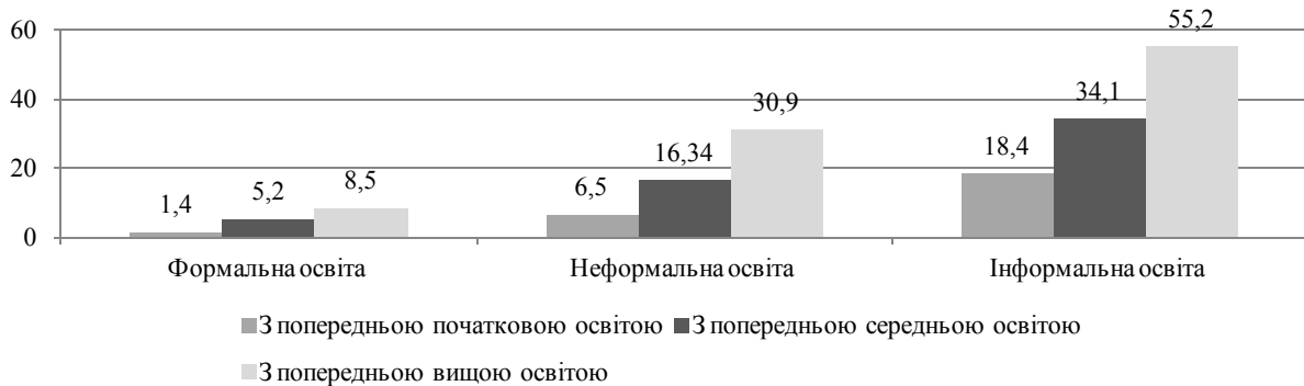
Рисунок 2 – Кореляція рівня попередньої освіти країн-членів ЄС та залученості до різних форм здобуття освіти

Варто відмітити, що серед всіх складових безперервної освіти саме ІО має більшу кореляцію рівнів попередньої освіти та залученням з різними формами здобуття освіти (рис. 2, дані за 2007 рік).