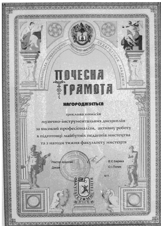
Рис. 3. Почесна грамота, якою нагороджена ПЩК музично-інструментальних дисциплін (зав. Заслужений працівник культури В. Л. Общанський).