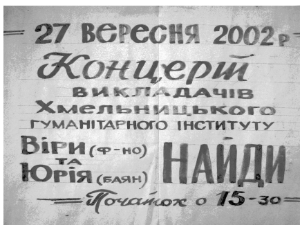
Рис. 1. Афіша сольного концерту Юрія та Віри Найдю в Ізяславській ДШМ.