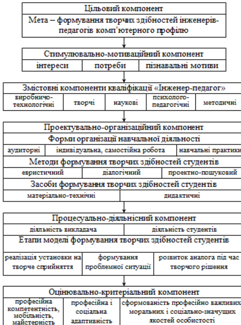
Рис. 2. Зміст компонентів методики формування творчих здібностей у майбутніх інженерів-педагогів комп'ютерного профілю

Професійні якості інженера-педагога комп'ютерного профілю характеризують його знання і вміння досягати поставлених цілей із мінімально можливими витратами ресурсів і часу. Його професіоналізм повинен базуватися на відповідній фундаментальній і фаховій підготовці, системному мисленні, ефективних методах обґрунтування рішень і вибору стратегій, організаційних здібностях. Сьогодні ми повинні готувати фахівця, який володіє професійними компетентностями, необхідними йому вже «завтра». Такий рівень підготовки майбутніх інженерів-педагогів у Тернопільському національному педагогічному університеті імені Володимира Гнатюка є визначальним для проектування змісту професійної освіти.