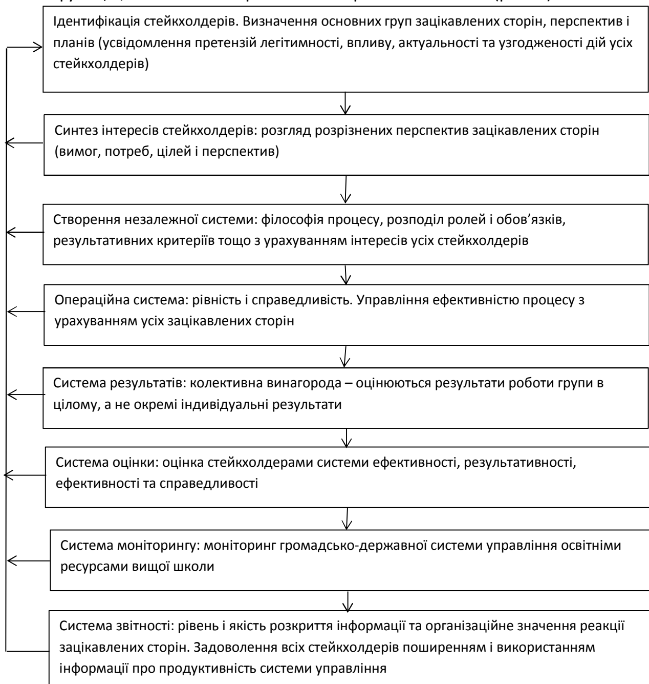
Рис. 2. Система функцій управління Незалежною Агенцією з управління освітніми ресурсами вищої освіти, де

Функціональна підсистема, що визначає функції, в яких віддзеркалюється особливості саме громадсько-державного управління освітніми ресурсами вищих навчальних закладів, передбачає послідовність таких функцій, які пов'язані прямим та зворотним зв'язком (рис. 2).