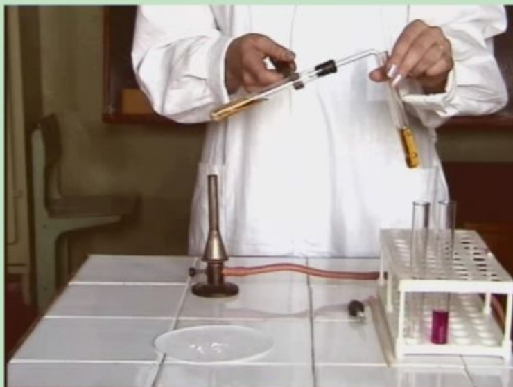
Рис. 2. Слайд з відеофрагментом досліду

Доведено, що ефективними засобами узагальнення й систематизації знань учнів є узагальнюючі таблиці та схеми. Застосування мультимедійних презентацій з ефектами анімації в навчальному процесі дозволяє використовувати вказані вище засоби на сучасному рівні, а саме: не пропонувати учням розглядати таблиці в готовому вигляді, не витратити час на креслення їх на дошці, а складати їх разом з учнями за допомогою кліку комп'ютерної миші. Наводимо зразок слайду з подібною таблицею в заповненому вигляді (рис. 3).