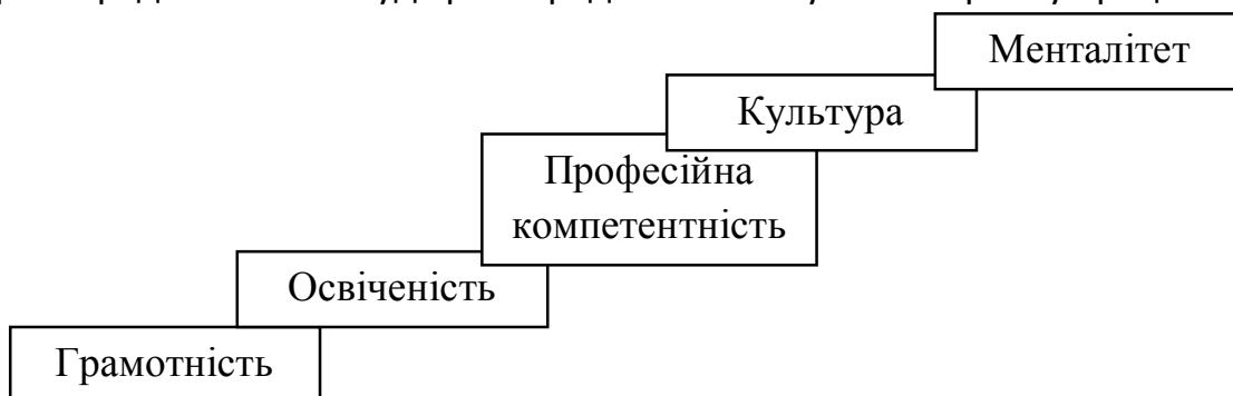
Рис. 1. Ієрархічна модель освіти (за Б. С. Гершунським)

її освіта виступає у двох іпостасях: як засіб самореалізації, самовираження і самоствердження особистості; як засіб стійкості, соціального самозахисту й адаптації людини в умовах ринкової економіки, як її власність, капітал, яким вона розпоряджається чи буде розпоряджатися як суб'єкт на ринку праці.