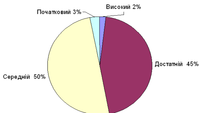
Рис. 2. Рівень знань учнів груп професійно-технічного навчання зі спеціальних предметів за 2012/2013 навчальний рік

На завершальному етапі наукового дослідження нами проведено аналіз рівня знань учнів груп професійно-технічного навчання зі спеціальних предметів за 2012/2013 навчальний рік (рис. 2)