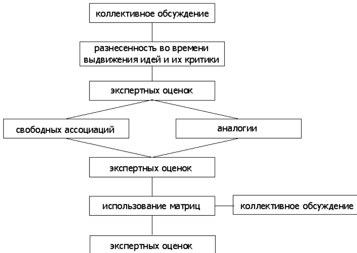
Рис. 2. Структура обобщенного метода активизации творческой деятельности

За приемами, отсекающими варианты решения, должны следовать приемы, расширяющие границы поиска. Это приемы «свободные ассоциации» и «аналогия». Считаем, что целью применения данных приемов является содержательное наполнение выявленных двух классов признаков. Так, эффективна аналогия признаков проектируемой машины с существующими машинами, предназначенными для выполнения схожих функций, а прием «свободные ассоциации» предполагает рассмотрение ранее несуществующих признаков, а также фантастических свойств или узлов. Целесообразно сформировать перечень одного класса признаков с помощью приема аналогии, а второго класса – с помощью приема свободных ассоциаций. Окончательный отбор набора варьируемых признаков осуществляют с повторным использованием приема экспертных оценок.