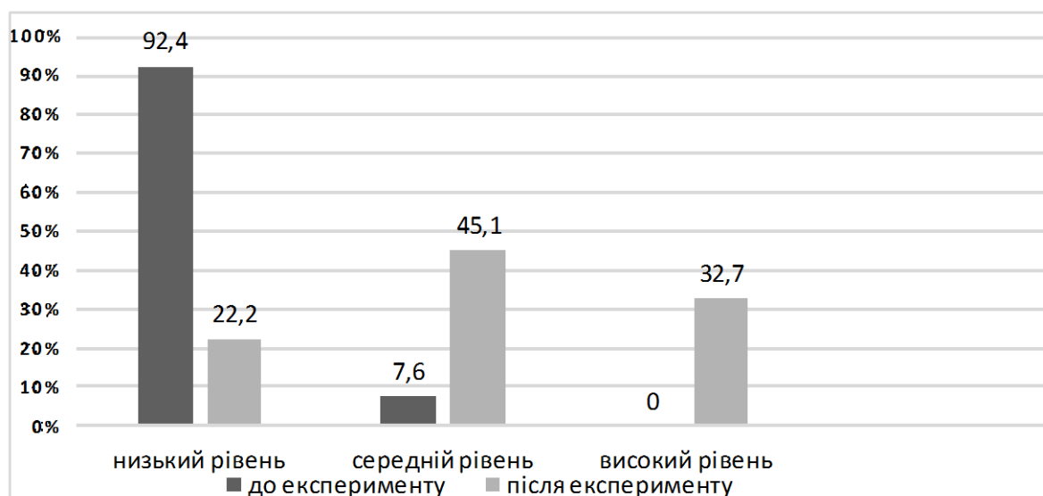
Рис. 3. Динаміка розподілу вчителів експериментальної групи за рівнями сформованості технологічних умінь підтримки здоров'язбережувального навчання до та після проведення експерименту

На рис. 3 показано, що в результаті проведеного масового формувального експерименту високий рівень сформованості технологічних умінь підтримки здоров'язбережувального навчання в учителів зріс на 32,7 %, а також покращились показники середнього рівня на 37,5 %, а низький рівень зменшився на 70,2 %.