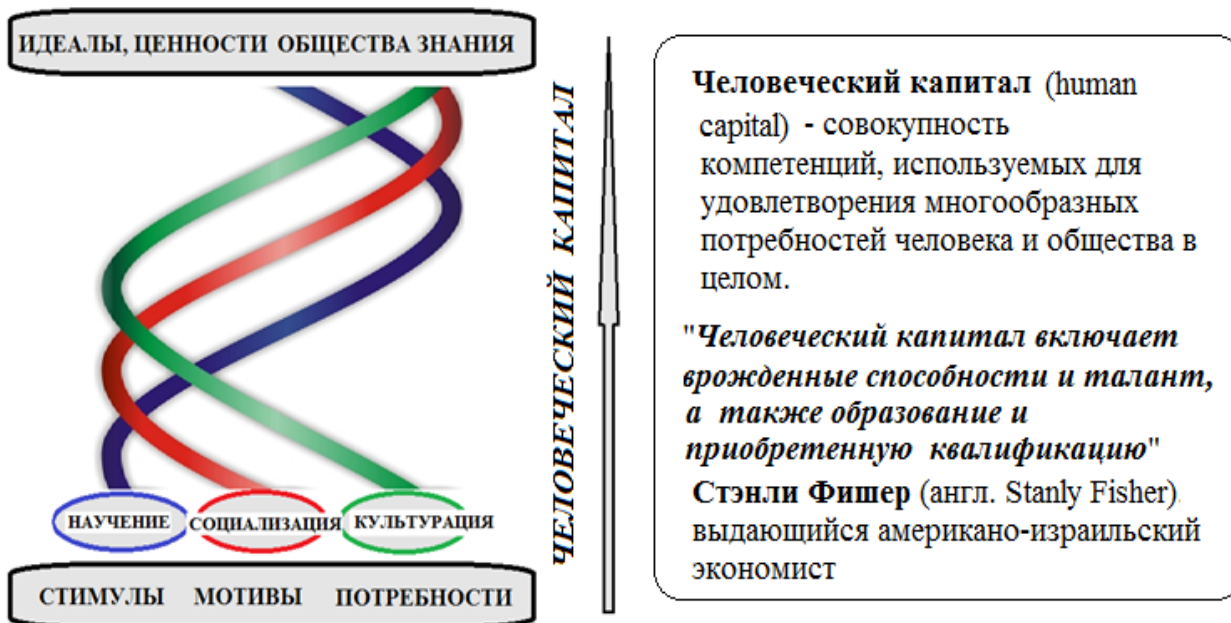
Рис. 2. Тройная спираль инновационного развития образования через динамику отношений научения, социализации и культурации

виде образовательной тройной спирали (рис. 2). Динамика образования при таком моделировании состоит в том, что на начальном этапе обучения взаимодействуют научение и социализация.