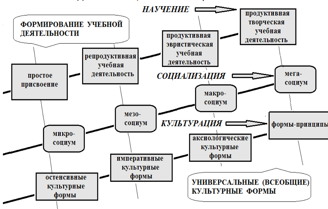
Рис. 1. Информационные воздействия на обучаемого (научение, социализация, культурация) и их результат в виде системы ступеней, закономерно вытекающих одна из другой

Указанное информационное воздействие сводится, в модельном представлении, к воздействию на человека трех групп внешних информационных потоков. В ряде предыдущих работ (в том числе [6]) показано, что следствием целенаправленных информационных влияний на обучаемого являются три взаимозависимые и дополняющие друг друга составляющие образования: научение ( a teaching ), социализация ( a socialization ) и культурация ( a cultururation ). По сути, это три взаимосвязанных процесса информационного обмена учащегося с окружающей его информационно-образовательной средой. Каждый из этих процессов закономерно развивается (рис. 1), что вполне корреспондируется с известной мыслью Гегеля о том, что «мы должны рассматривать природу как систему ступеней, каждая из которых необходимо вытекает из другой» (Гегель Г. В. Ф. Соч. Т. 29. М. : Изд-во АН СССР, 1956. – С. 214).