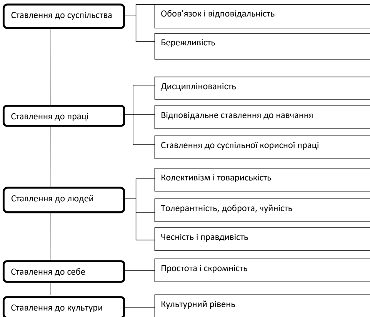
Рис. 2. Критерії та показники визначення рівня вихованості дітей дошкільного віку із ЗПР

До того ж, вважаємо за необхідне зазначити, що спеціальний освітній процес для дітей дошкільного віку із ЗПР повинен протікати в спеціальних освітніх умовах, які передбачають: освітнє середовище (комплекс умов, які забезпечують розвиток дітей у дошкільній організації: взаємодія учасників педагогічного процесу, розвивальне предметно просторове середовище (частина освітнього середовища, що являє собою спеціально-організований простір, матеріали, обладнання для розвитку дітей дошкільного віку відповідно до їх психолого-педагогічних характеристик), зміст дошкільної освіти); організаційне забезпечення (нормативно-правове забезпечення; організація різних форм навчання в спеціальних закладах дошкільної освіти; фінансові умови, інформаційне забезпечення); матеріально-технічне забезпечення (навчально-методичний комплект, обладнання, оснащення відповідно до вікових та індивідуальних особливостей дітей, санітарно-епідеміологічних вимог,