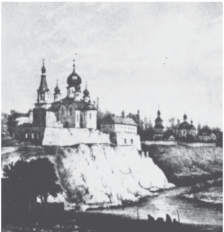
«Звягель (Новоград-Волинський). Рештки фортеці, збудованої в XVII ст.». Малюнок Н. Орди. Літографія Фаянса. 1860-ті рр.

«Мандрівка з приємністю та й не без моралі»