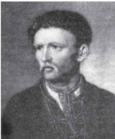
В. Тропінін. «Портрет старого українця». (Устим Кармелюк?). Олія

«У Кам'янці-Подільському 3 квітня 1846 року Чуйкевич записав до альбому Шевченка три народних пісні: „Пливе щука з Кременчука, тече собі стиха“, „Зійшла зоря ізвечора та й не назорилася“, „Ой Кармелюче, по світу ходиш“».