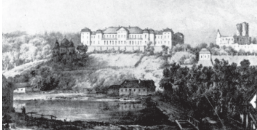
«Вишневець». Малюнок Н. Орди, літографія Фаянса. 1860-ті рр.

В. Щурат. «Шевченко про Галичину в 1846 р.»