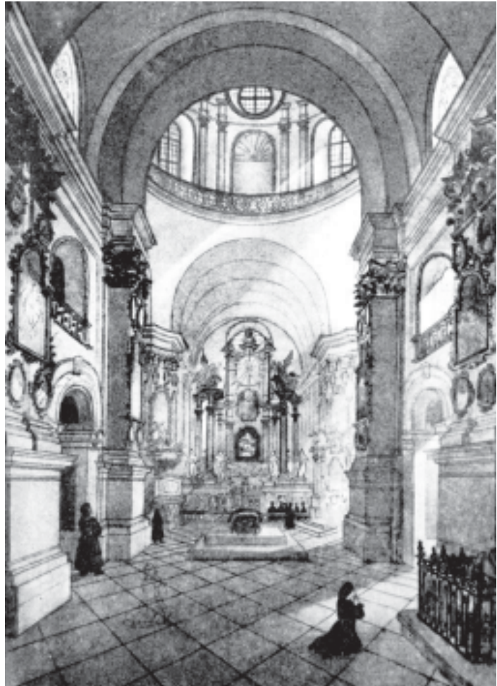
Т. Шевченко. «Собор Почаївської лаври. Внутрішній вигляд». Акварель. 1846

Почаїв. Готель Почаївської лаври, де зупинявся Т. Шевченко 1846 р. Фото