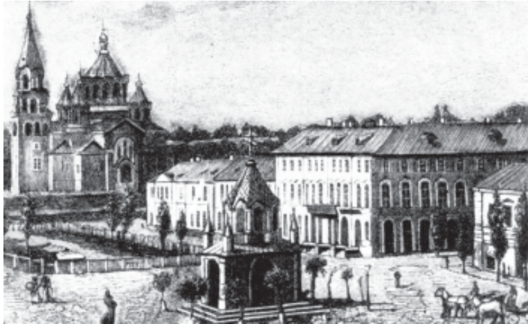
«Житомир». Гравюра другої половини XIX ст.

«Путевые записки о Западной и Юго-Западной России»