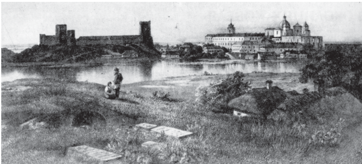
«Любартів замок у Луцьку». Малюнок Г. Потоцької, гравюра Вагнера. 1820