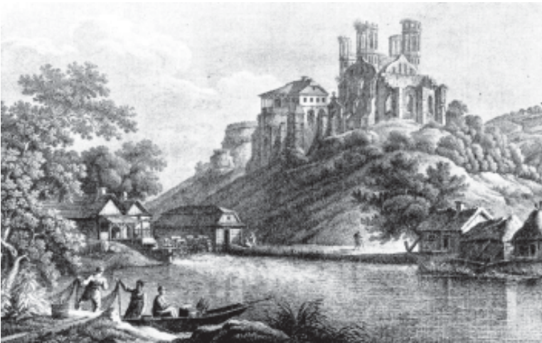
«Острог. Руїни замку князів Острозьких». Малюнок З. Фогеля, гравюра Гамера. 1820

«Із капуцинського монастиря я пішов на гору, де стояли руїни православної церкви Богоявлення, а біля неї башти, що були в огорожі двору князів Острозьких, і залишок їхнього дому, що його займали тоді якимсь присутственным місцем. На церкві не було даху, і самі стінки в багатьох місцях загрожували падінням, так що ходити між цими руїнами було небезпечно. На верхівці башт мальовниче виросли випадково насяніні дерева».