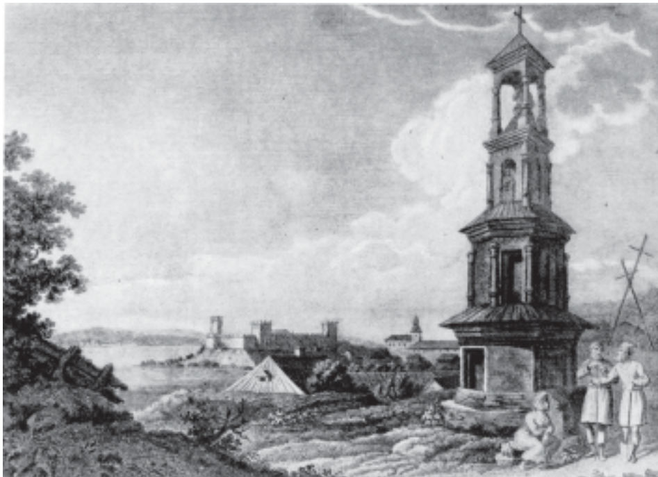
«Божниця в Луцьку». Гравюра Діаментовського. XIX ст.