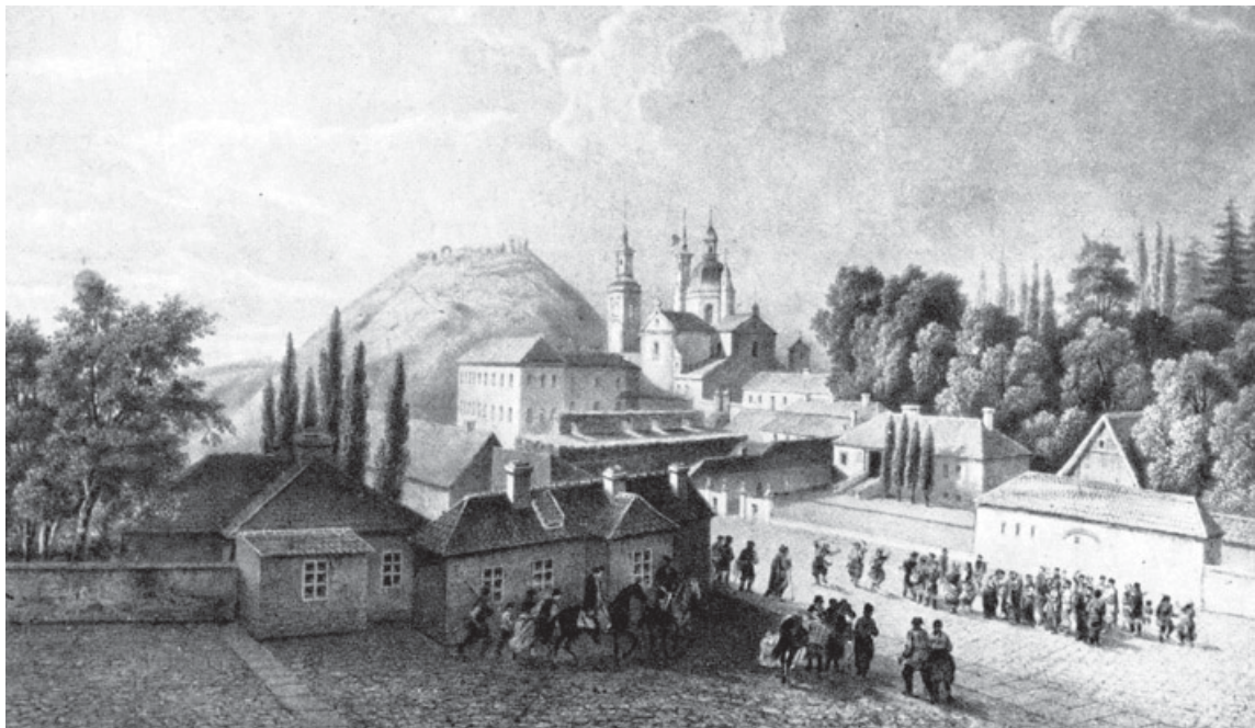
«Кременець». Малюнок І. Зейдліца, літографія Лемерсьє. 60-ті рр. XIX ст.

Невідомий художник. «Портрет Тадеуша Чацького». Початок XIX ст.