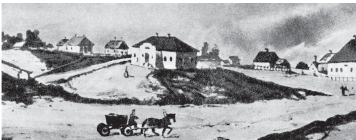
«Поштова контора повітового містечка». Малюнок XIX ст.