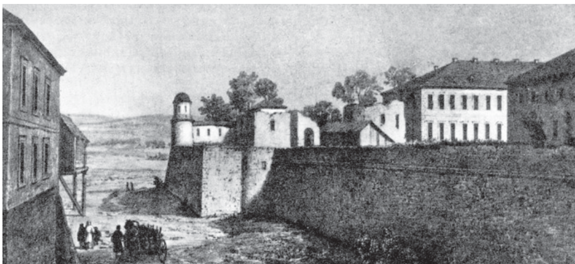
«Дубно на Волині, над річкою Іквою». Малюнок Н. Орди, літографія Фаянса. 60-ті роки XIX ст.

Матеріали рубрики уклад М. О. Сташенко , кандидат фізико-математичних наук, доцент, головний редактор науково-методичного вісника „Педагогічний пошук”