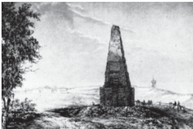
«Берестечко. Місце бою Б. Хмельницького з поляками. На першому плані — пам'ятник на могилі аріанина Пронського». Малюнок Н. Орди, літографія Фаянса

В. Щурат. «Шевченко про Галичину в 1846 р.»