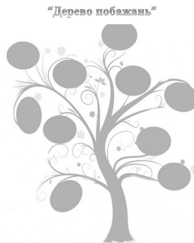
Рисунок 2. Методика «Дерево побажань», спрямована на виявлення кола потреб у молодших школярів для формування культури взаємин у добродійній діяльності

Методика «Дерево побажань» передбачала усний інструктаж та пояснення змісту роботи, яка спрямовувалась на визначення кола потреб у молодших школярів для формування культури взаємин у добродійній діяльності. Ми не обмежували напрямок дитячих думок, лише акцентувалась увага на тому, щоб респонденти висловлювали, які у них побажання для повноцінного розвитку культури взаємин добродійною діяльністю. Назву і структуру методики ми прив'язали саме до дерева тому, що воно символізує розвиток, життя, що є символічним для нашого дослідження.