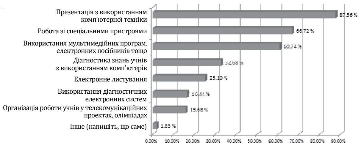
Рисунок 2. Використання елементів ІКТ у навчально-виховному процесі