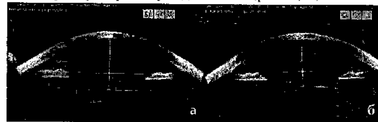
Рис. 3. Оптична когерентна томографія переднього відрізка ока пацієнта С. з діаметральною фіксацією капсульного мішка: а - меридіан підшивання ПФК; б - меридіан нахилу ІОЛ (кут нахилу становить 2,6 град.).

Оцінка децентрації та нахилу ІОЛ проводилась з урахуванням даних групи порівняння, до якої увійшли 40 пацієнтів з транссклеральним підшиванням ІОЛ із строком спостереження 6 міс. та більше. Нахил ІОЛ оцінювався в меридіані, перпендикулярному меридіану підшивання (рис. 3, 4).