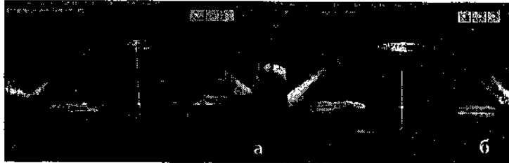
Рис. 4. Оптична когерентна томографія переднього відрізка ока пацієнта О. з транссклеральною фіксацією ІОЛ: а - меридіан підшивання опорних елементів ІОЛ; б - меридіан нахилу ІОЛ (кут нахилу становить 12,5 град.).

вірогідної різниці у співвідношенні груп I та II із групою порівняння за даними нахилу ІОЛ ( P < 0,05 ). Максимальний кут нахилу в групі I склав 3,7 град., в групі II - 4,2 град., в групі порівняння - 12,5 град. В останній групі нахил більше 10,0 град. було виявлено на 3 (18,8%) очач. Середні дані децентрації та нахилу ІОЛ наведено в таблиці 3.