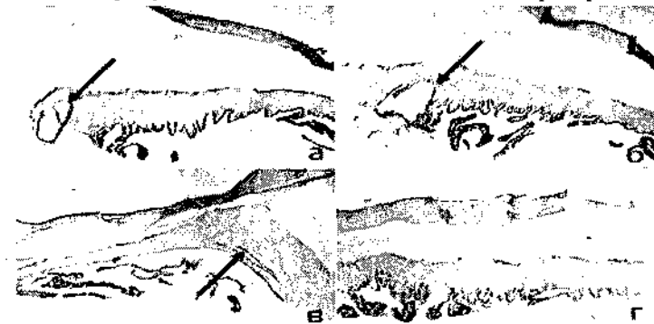
Рис. 2. Мікрофотографії ока кролика. Формування замкненого каналу навколо гаптичного елементу (позначено стрілкою): а - у райдужній оболонці; б - у циліарному тілі, в - у склері; г - контрольна ділянка. Забарвлення гематоксиліном-еозином, збільшення \times 12 .

стану підшитої пристрою для фіксації. Було виявлено зрощення гаптичного елементу ПФК з тканинами райдужки та циліарного тіла різного ступеня вираженості. На всіх очах спроби механічно змістити ПФК після перетинання фіксуючого вузла зовні продемонстрували збереження стабільного положення пристрою. Гістологічне дослідження препаратів виявило формування замкненого каналу в м'яких тканинах навколо гаптичного елементу (рис. 2, а-б). В одному випадку формування подібного каналу було також виявлено в товщі склери (рис. 2, в).