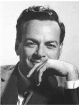
Рис. 1. Нобелівський лауреат Річард Фейнман [3].

Префікс "нано" походить від грецького слова "нанос", що означає "карлик", і сьогодні він використовується в якості префікса для опису об'єктів, розміром 10^9 м. Таким чином, нанотехнології - це галузь дослідження і виробництва об'єктів, які знаходяться у межах від 1 до 100 нм. Загальна концепція нанотехнологій була представлена 29 грудня 1959 р. Річардом Фейнманом (рис. 1) у його легендарній лекції на тему "Там знизу - багато місця" на щорічній зустрічі Американського фізичного товариства у Каліфорнійському технологічному інституті [2, 5].