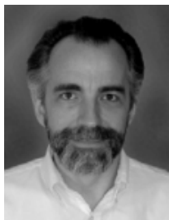
Рис. 2. "Батько нанотехнології" Кім Ерік Дрекслер [9].

Пізніше велика рушійна сила для того, щоб зробити нанотехнології важливою науковою областю, була надана американським ученим К. Еріком Дрекслером (якого також називають "батьком нанотехнології" [7]) (рис.2). У 1981 р. він опублікував статтю, в якій описав, як білкові агрегати можуть служити в якості функціональних одиниць, таких як двигуни, кабелі та насоси нано-масштабу. У цій статті Дрекслер навів порівняння компонентів, які наявні в кожній живій клітині, з компонентами, які використовуються для машинобудування [3]. Він запропонував метод побудови молекул примусовим стисканням атомів один до одного в бажані молекулярні форми, який потім охрестили "механосинтезом" [8]. Книги Дрекслера "Двигуни творення: майбутня ера нанотехнології" (1986 р.) та "Наносистеми: молекулярні машини, виробництво і обчислення" (1992 р.) остаточно закріпили напрямок молекулярної нанотехнології [3]. Він також придумав термін "сірий слиз", щоб описати те, що може статися, якщо гіпотетична самовідтворювана молекулярна нанотехнологія вийде з-під контролю [7].