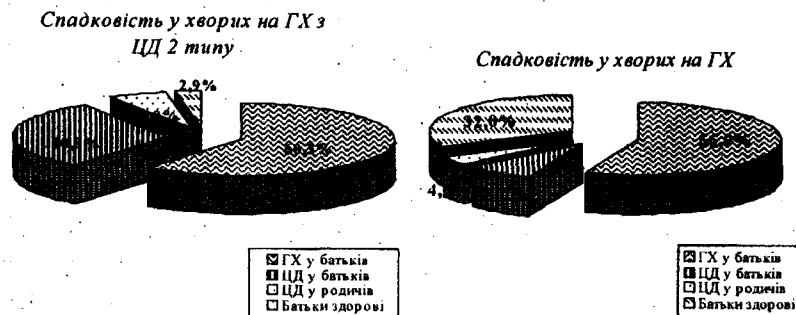
Рис. 1. Розподіл хворих за фенотипом батьків.

також у 25,9% виявився 3 ступінь; за рахунок чоловічої статі, група віком 56 - 65 років характеризувалась збільшенням осіб з 3 ступенем підвищення АТ за рахунок пацієнтів з ГХ та ЦД 2 типу (60%) в порівнянні з хворими на ГХ (13,3%), у осіб старше 66 років відзначалась АГ 3 ступеню. Виявлені гендерні відмінності у рівні АТ знаходять відображення і в інших дослідженнях [4,5], так зокрема дані Фремінгемського дослідження вказують на те, що у віці до 40 років існує ризик розвитку кардіоваскулярних подій у кожного другого чоловіка та у кожної третьої жінки, однак серцево-судинні захворювання розвиваються у жінок в середньому на 10 років пізніше, та ризик їх розвитку до менопаузи у 2-4 рази нижчий. Факторами, що провокують виникнення та прогресування кардіоваскулярних захворювань у жінок є - менопауза, оваріоектомія, гормональна контрацепція. З віком рівень захворюваності у жінок зростає та вирівнюється у віці 60-70 років, але летальність залишається нижчою упродовж життя.