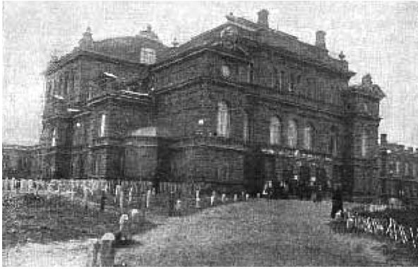
Рис. 3. Народний Дім Харківського Товариства поширення в народі грамотності