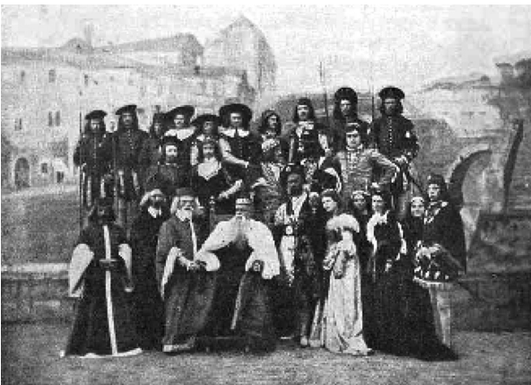
Рис. 4. Вистава «Король Лір» на сцені Народного Дому

Наприклад протягом 1906 року відбулися 71 спектакль, чотири опери, два концерти, одна лекція, 20 безкоштовних народних читань, ялинка для дітей, а всього на заходах побувало 67182 відвідувача. Того ж року діяльність Народного Дому була відзначена Почесним дипломом Бельгійської міжнародної виставки. [5, с. 216–225]