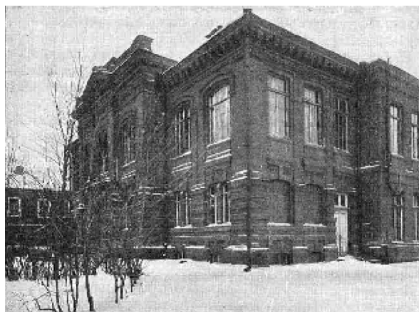
Рис. 2. Будівля 2-ї школи Харківського Товариства поширення в народі грамотності, де розташовувалися правління, декоративно-малювальна школа та комітети

Як і багато його колег, учений долучився до активної участі у діяльності Харківського Товариства поширення в народі грамотності (Далі — Товариство), що було створене ще у 1869 році видатним ученим М. М. Бекетовим. Помітний підйом своєї активності Товариство отримало в період у 1900–1904 рр., коли В. Я. Данилевський головував у ньому. У цей час до структури Товариства входили три щоденних загальноосвітніх школи, жіноча та чоловіча недільні школи, п'ять безкоштовних народних бібліотек-читалень, комісія з облаштування народних читань, комітет з видання книг для народу, комітет з облаштування сільських бібліотек, комітет з облаштування літніх шкільних колоній, комітет з управління народними домами, довідково-педагогічний комітет з бібліотекою та музеєм наочних посібників, шкільно-педагогічний комітет, декоративно-малювальна школа. В повітах Харківської