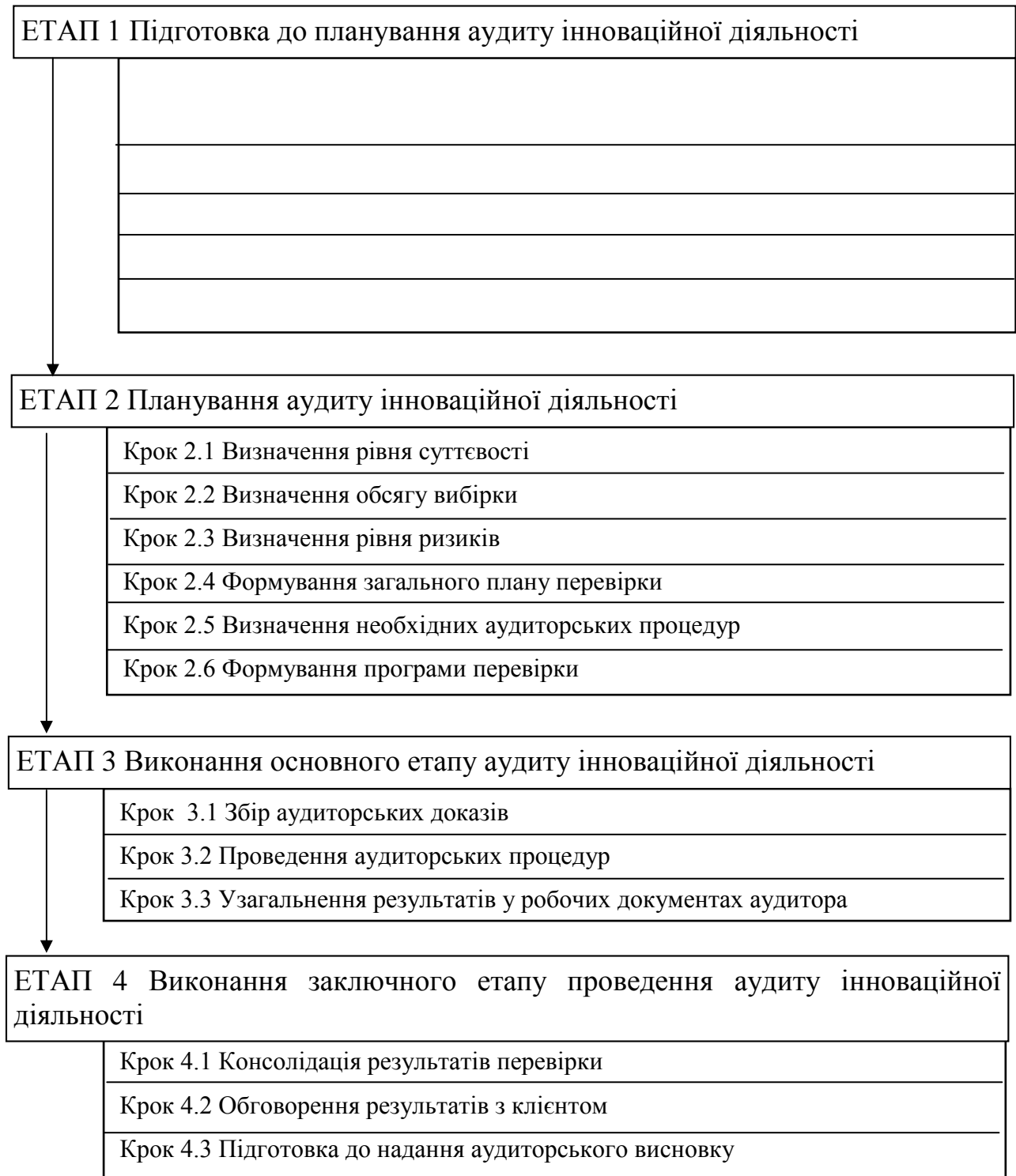
Рис. 2. Етапи і кроки з удосконалення методичного підходу до аудиту інноваційної діяльності

При проведенні перевірки слід приділяти значну увагу підготовці до планування аудиту інноваційної діяльності (етап 1), що дозволить зменшити витрати часу на виконання процедур та на запит інформації від підприємства-клієнта.