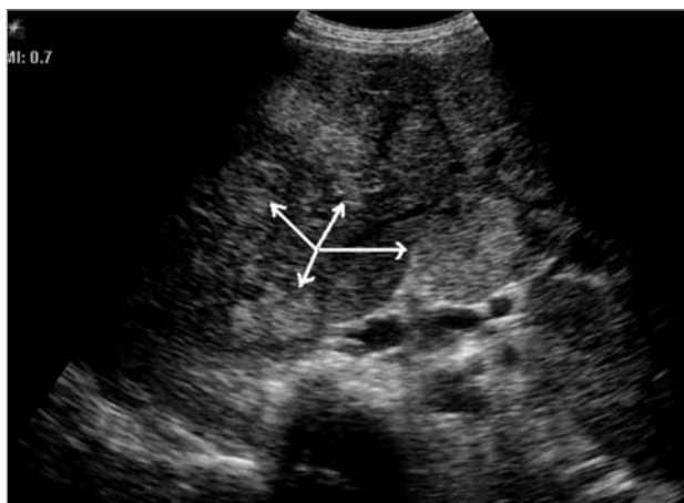
Рис. 1. Эхограмма печени ребенка 5 лет. Датчик 5 МГц (стрелками обозначены участки фиброза в печени)