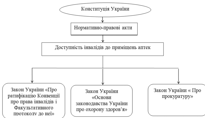
Рис. 1. Захист прав пацієнтів з обмеженими фізичними можливостями

Окрім того, в Україні захист прав пацієнтів та доступність інвалідів до приміщень аптек базується на принципах, що закладено в Конституції України [7] та відповідних нормативно-правових документах, зокрема (рис. 1):