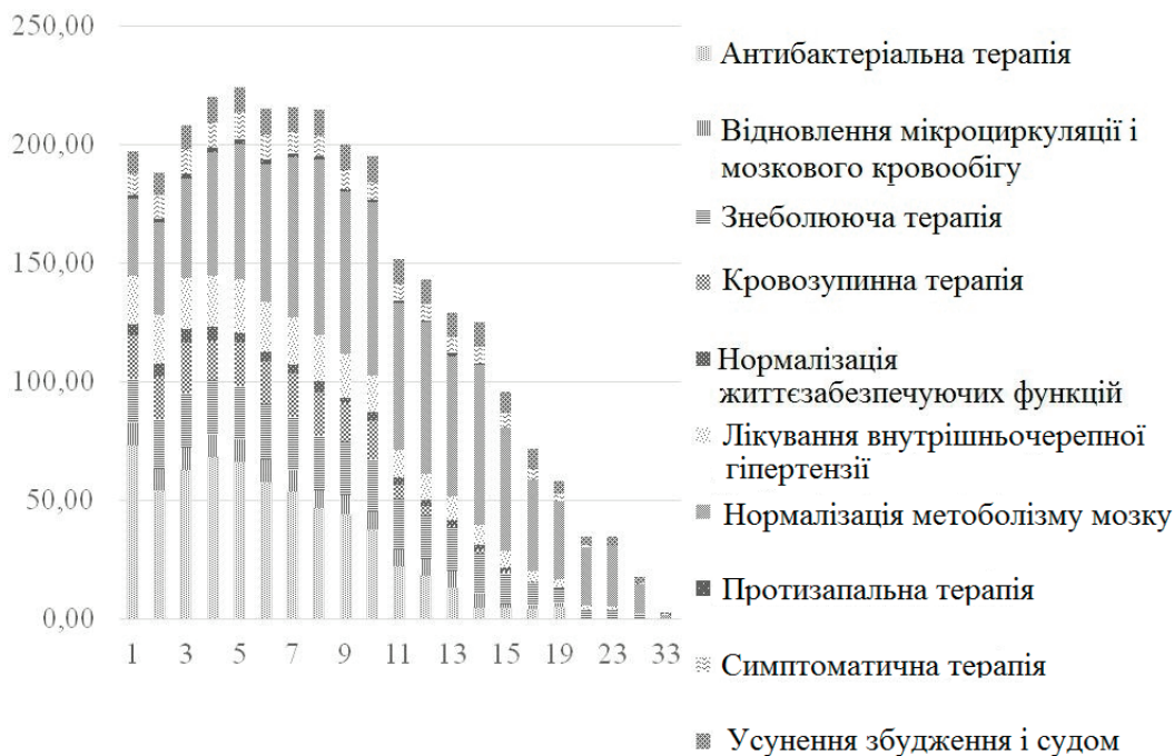
Рис. 3. Вартість лікування хворих із травмами та пораненнями головного мозку

вартість лікування зменшувалася від 214,45 грн до 125,21 грн. На третьому тижні лікування вартість ЛЗ, які необхідні для лікування військовослужбовців, зменшується у три рази порівняно з вартістю ЛЗ, які призначають на першому тижні лікування (рис. 3).