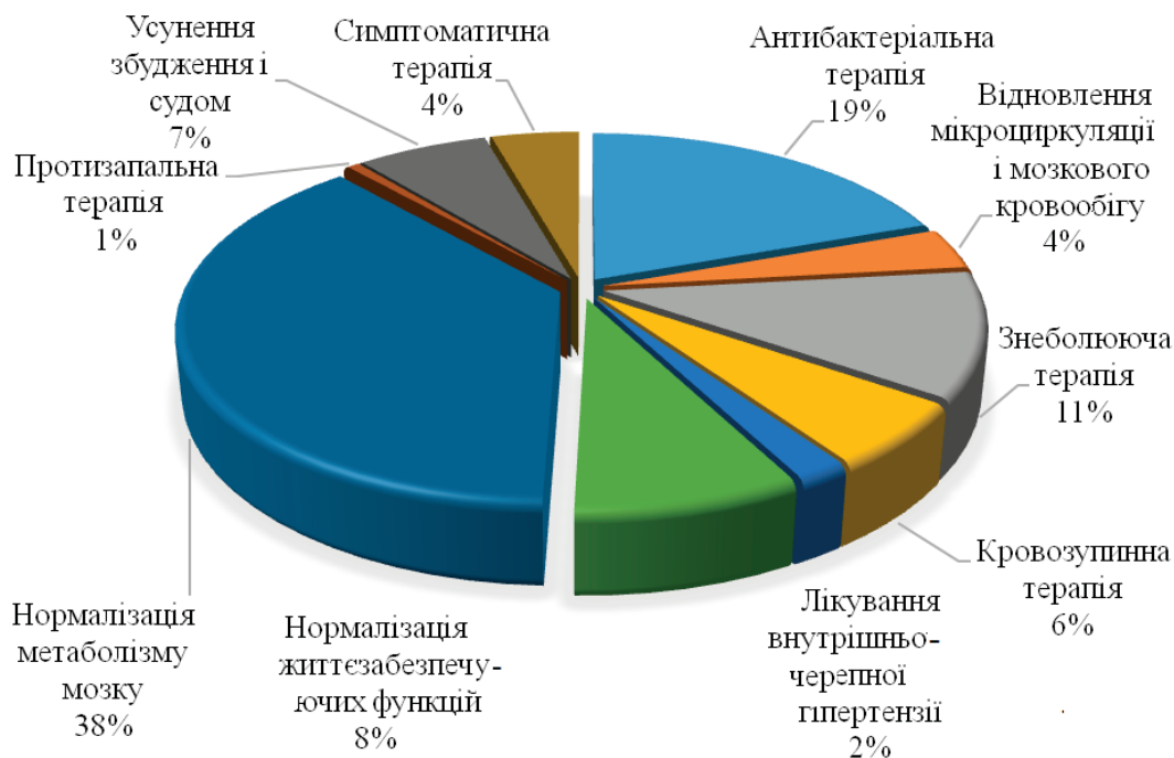
Рис. 2. Розподіл вартості за напрямками лікування хворих із тяжкими травмами та пораненнями головного мозку

Наступним етапом було визначення вартості ЛЗ за напрямками. Враховуючи те, що за всіма напрямками здійснюють лікування військовослужбовців лише з тяжкими травмами та пораненнями ГМ, тому нами були проаналізовані лише 52 картки стаціонарного хворого. Так, встановлено, що найвартіснішим напрямком лікування травм та поранень ГМ із вищенаведеного переліку є відновлення метаболізму мозку, вартість лікування препаратами становить у середньому 1 261,21 грн на 1 особу на курс, що становить 38% від загальної вартості лікування (рис. 2). Наступні позиції представляють: антибактеріальна терапія – 649,27 грн (19%), знеболювальна терапія – 375,90 грн (11%), нормалізація життєзабезпечуючих функцій – 274,28 грн (8%), усунення збудження і судом – 219,63 грн (7%). Найменшою вартістю характеризується протизапальна терапія, вартість лікування становить лише 19,96 грн (1%).