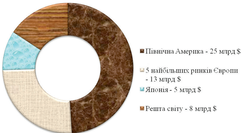
Рис. 2. Об'єм ринку попередньо заповнених шприц-ручок

Обсяги витрат на ПЗШР на світовому ринку подано на рис. 2.