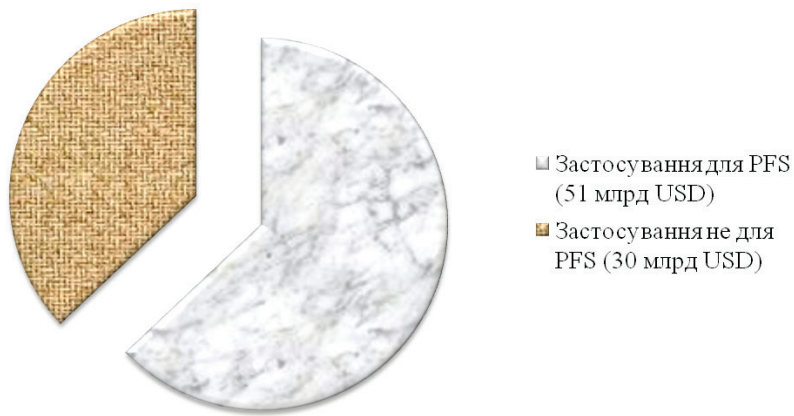
Рис. 1. Ін'єкційні лікарські засоби, що придатні для застосування попередньо заповнених шприц-ручок

Обсяги витрат на ПЗШР на світовому ринку подано на рис. 2.