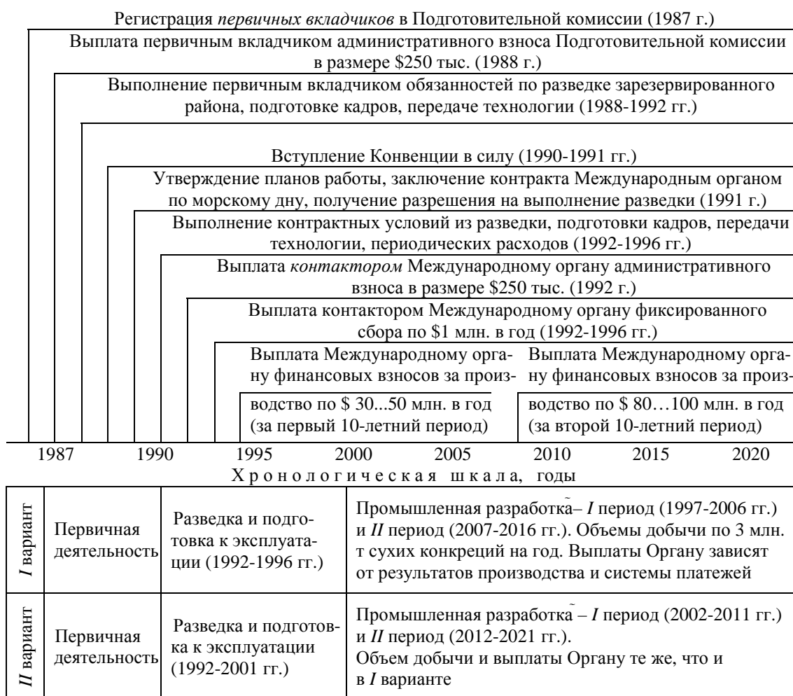
Рис. 3. Схема выполнения обязанностей первичного вкладчика и контрактора

Было отмечено, что Украина может и должна внести весомый вклад в решение проблемы освоения морских месторождений, используя свой научно-технический и промышленный потенциал, а также подтвержден взаимный интерес к сотрудничеству в морском горнометаллургическом производстве [6].