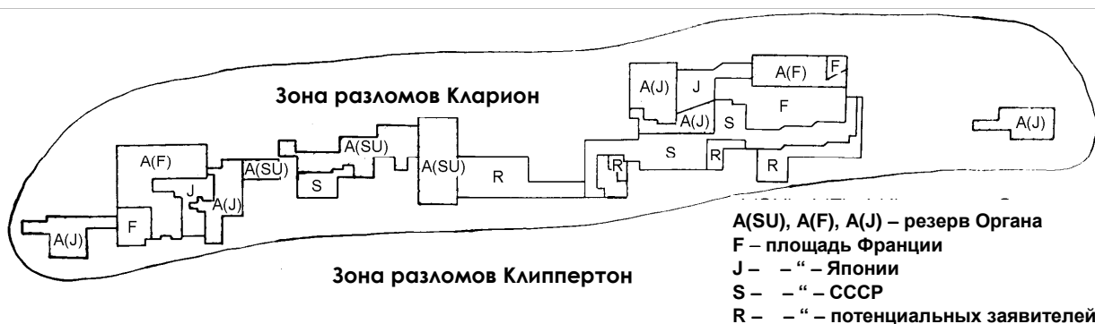
Рис. 2. Площади первоначальных вкладчиков Fig. 2. Areas of primary depositors