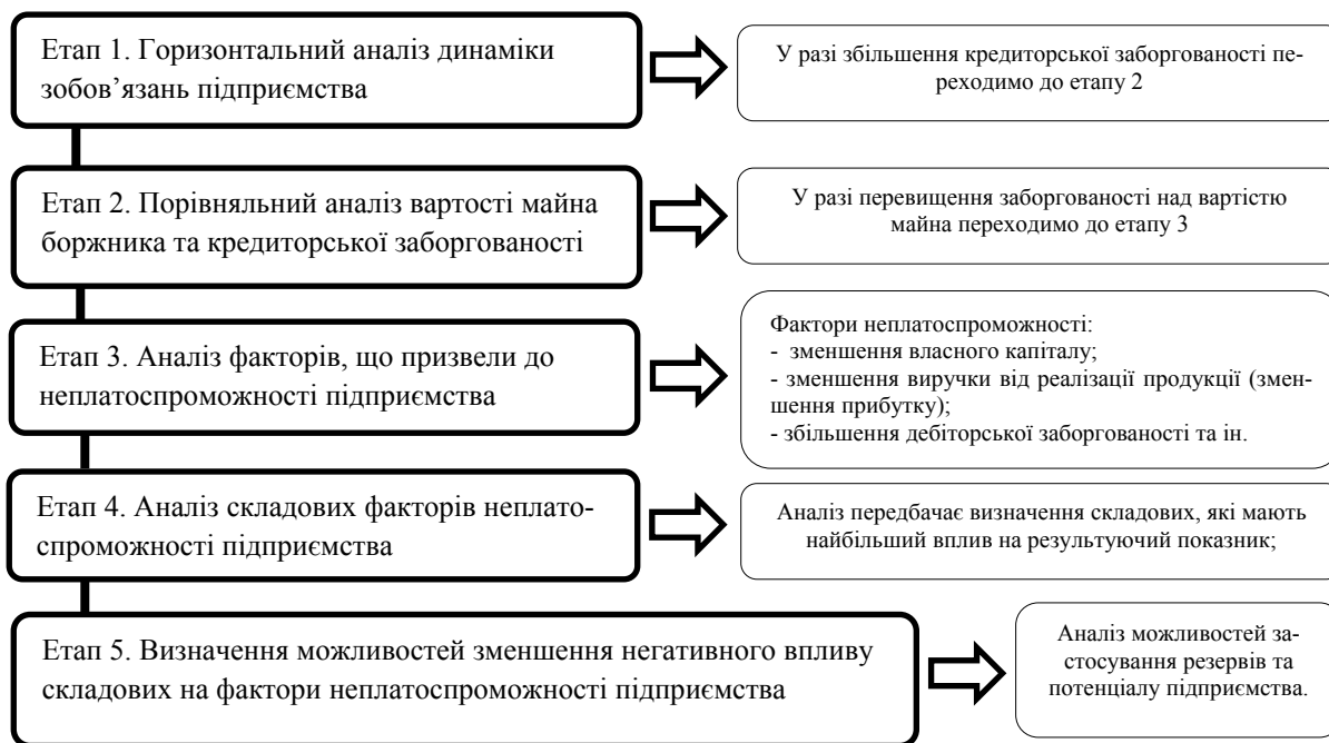
Рисунок 2 – Алгоритм діагностики банкрутства підприємства

Резерви зростання обсягу виробництва можуть бути наступні: створення додаткових робочих місць; прирощення обсягів виробництва від введення нового обладнання; прирощення від ліквідації втрат робочого часу; ліквідація втрат часу роботи обладнання; впровадження заходів з удосконалення технології та організації виробництва і праці; поліпшення організації виробництва і праці; зниження норм витрат сировини і матеріалів у результаті впровадження нових технологій.