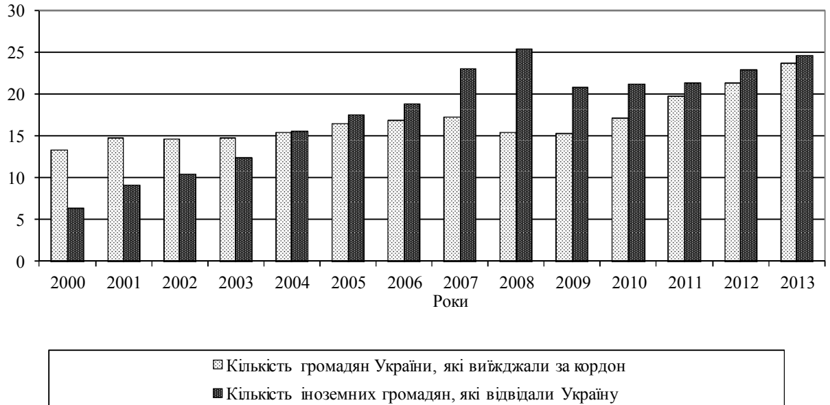
Рисунок 1 – Динаміка туристичних потоків України у 2000-2013 рр. Джерело: побудовано автором на основі даних [4]

Незначна частка організованого туристичного потоку пов'язана із зростанням кількості самостійно подорожуючих українців. Необхідно зазначити, що у 2010-2013 рр. відбулися зміни у структурі туристичних потоків у порівнянні з 2008-2009 рр. Так, більшість українців (у 2011 р. – 57 %, у 2012 р. – 65 %, у 2013 р. – 73 %) почали надавати перевагу подорожам за кордон, а частка внутрішнього туризму у структурі туристичних потоків постійно знижується (у 2011 р., 2012 р. та 2013 р. склала 32 %, 26 % та 20 % відповідно). У 2008 р. та 2009 р. у структурі туристичних потоків переважав внутрішній туризм – 46 % та 48 % відповідно.