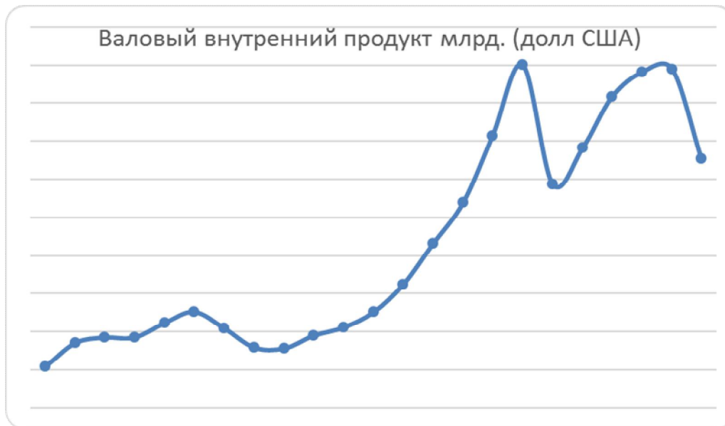
Рисунок 3 - Рисунок 2 – ВВП Украины с 1992 по 2014 годы [2]

Как видно показатель постоянно увеличивается, однако показатель, отраженный в национальной валюте, при рассмотрении значений в долларе США значения сильно изменится, поскольку за рассматриваемый период происходили значительные колебания курса гривны относительно других валют. Поэтому рассмотрим данные показатели валового внутреннего продукта в динамике, но уже в долларовом эквиваленте.