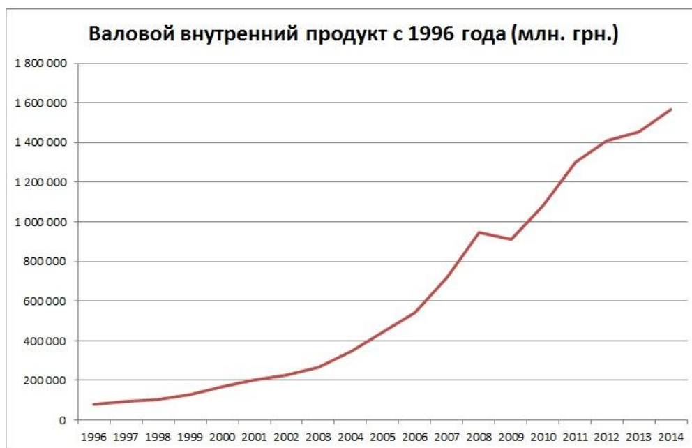
Рисунок 2 – ВВП Украины с 1996 по 2014 годы [2]

Более точно проследить изменения ВВП Украины можно на следующем рисунке 2. Приведен график характеризующий динамику изменений ВВП в период с 1996 по 2014 годы, показатель ВВП приведен в национальной валюте Украины – гривне, которая пришла на смену обесценившемуся рублю.