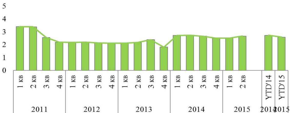
Рисунок 2 – Індекс інвестиційної привабливості ЕВА [4]

Ще одним прикладом неефективного функціонування інвестиційного законодавства є показники рейтингів в яких Україна займає низькі позиції. Негативний показник, демонструє індекс інвестиційної привабливості країни (рис. 2).