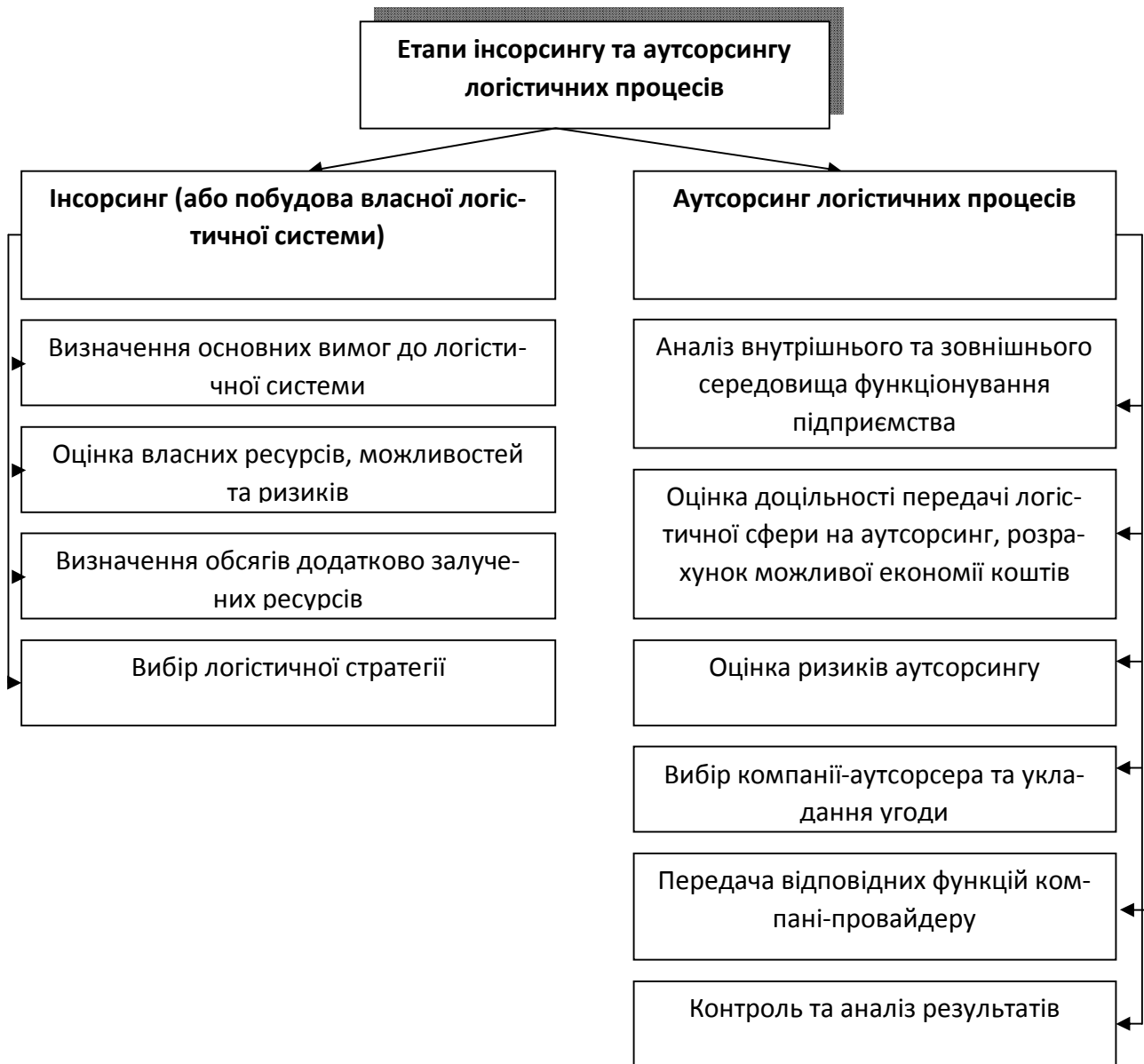
Рисунок 3 - Етапи впровадження інсорсингу та аутсорсингу логістичних процесів на підприємстві