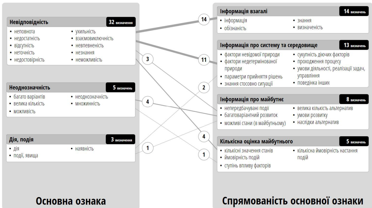
Рисунок 2 – Узагальнена декомпозиція поняття «невизначеність» Джерело: розроблено автором за [13, 15–22]