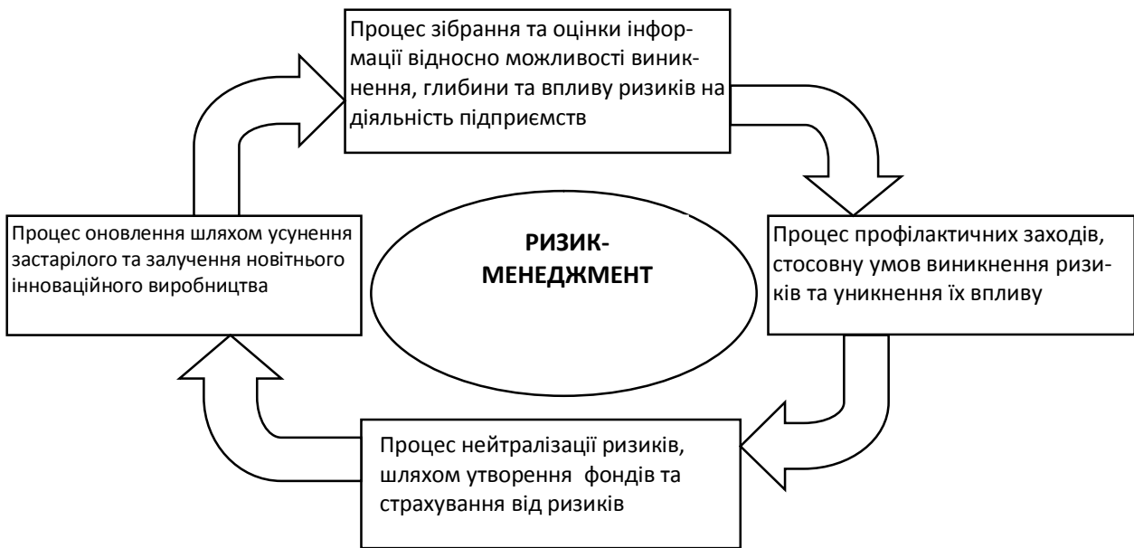
Рисунок 2 – Схема сутності «ризик-менеджменту» як якісно перетворюючого процесу на підприємствах (розроблено автором на основі [1, с.78-92;3, с.46])

Схема якісно перетворюючого процесу «ризик-менеджменту» на підприємствах відображена на рис. 2, з якого видно послідовність етапів такого процесу та визначені його змістовні характеристики.