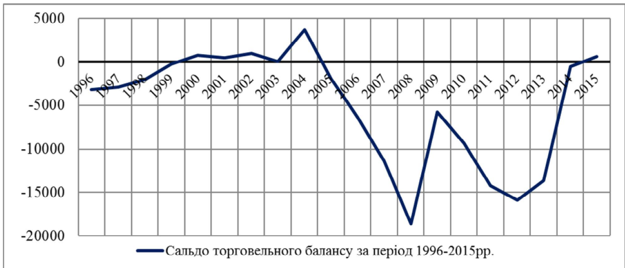
Рисунок 2 – Динаміка зміни сальдо зовнішньоторговельного балансу за період 1996-2015 рр.

Для наочного аналізу циклічності зовнішньоекономічної діяльності України будемо застосовувати метод графічного моделювання, за допомогою якого представимо сальдо торговельного балансу за період 1996-2015 рр. у вигляді графіка (Рисунок 2).