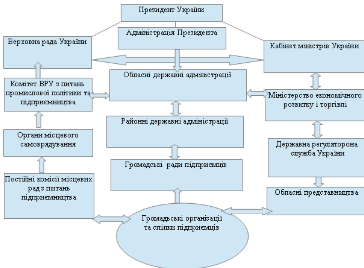
Рисунок 3 – Існуюча структура органів державного регулювання та підтримки МСП в Україні

З огляду на сучасні реалії діюча вітчизняна система державного регулювання підприємництва є недосконалою та бюрократичною. Сьогодні вона має наступний вигляд (рис. 3).