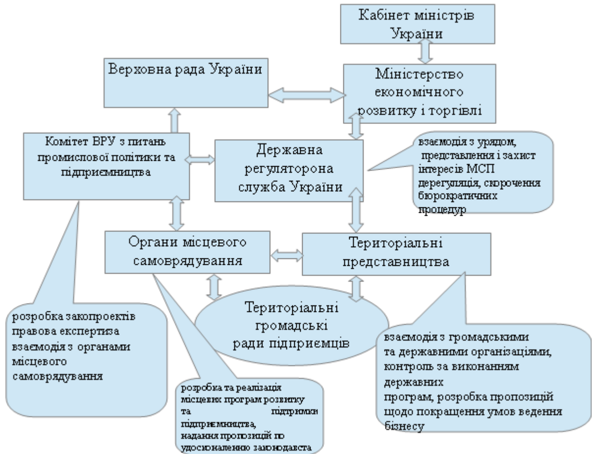
Рисунок 4 – Запропонована структура органів державного регулювання та підтримки МСП в Україні

Висновки та наукова новизна. Виходячи з вищенаведеного, першим кроком щодо удосконалення системи державної підтримки МСП повинно стати удосконалення структури органів державного регулювання підприємництва (рис. 4).