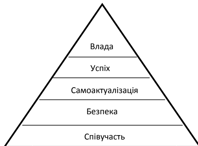
Рис. 2. Ієрархія потреб українців

Складено автором на основі [проекту WVS]. За результатом опитування можна розглянути ієрархію потреб українців (див. рис. 2) на основі таблиці 1.