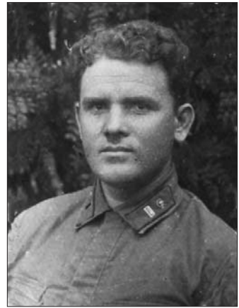
Ілля Зайченко 1939 р.

1936 року І.Л. Зайченко на основі цитологічного аналізу клітин, що оточують кістковий гомотрансплантат, описав невідомий до цього процес розсмоктування кісткового трансплантату лейкоцитами за типом „таяння льоду“.