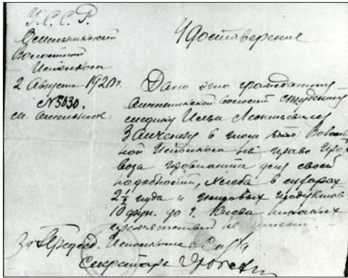
Дозвіл провозити провіант, виданий студенту Зайченку