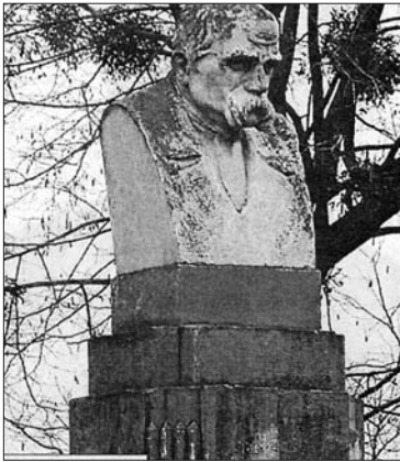
Тарас Шевченко. 1913 р. м. Винники (Львівщина)