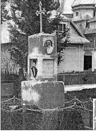
Тарас Шевченко 1914 р. с. Будилів (Франківщина)