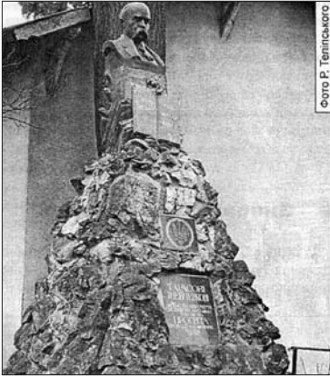
Тарас Шевченко. 1911 р. с. Лисиничі (Львівщина)