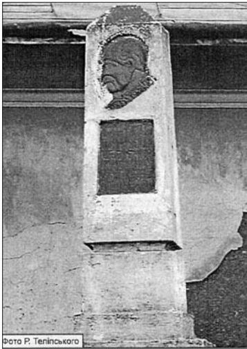
Тарас Шевченко 1914 р. с. Микулинці (Франківщина)